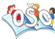
Preglednica 57: RaP popoldan, 2. b